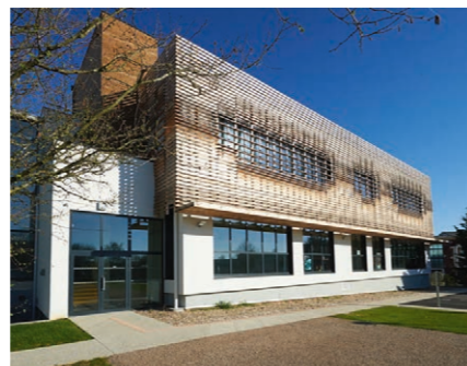
ESGT, 1 boulevard Pythagore, 72000 Le Mans

Les 27, 28 et 29 juin 2023, dans les locaux de l'ESGT