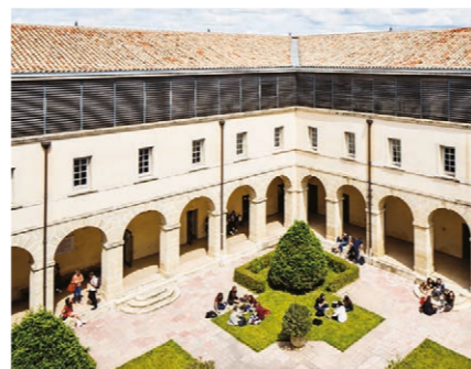
Faculté de droit et science politique, 39 rue de l'Université, 34060 Montpellier

Les 29 et 30 août 2023, dans les locaux de la faculté de droit et science politique